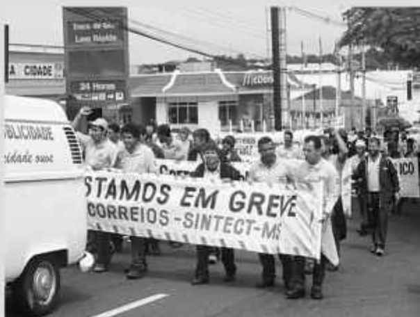
Trabalhadores aguardam contra-proposta dos Correios

O Tribunal Superior do Trabalho (TST) realiza audiência de conciliação entre a Empresa Brasileira de Correios e Telégrafos (ECT) e a Federação Nacional dos Trabalhadores dos Correios (Fentect). As negociações começam às 17 horas e serão intermediadas pelo presidente do TST, Vantuil Abdala. A categoria reivindica 47,17% de reajuste salarial. Já a ECT oferece 8% de reposição. Os servidores da estatal entraram em greve na última quarta-feira (14).