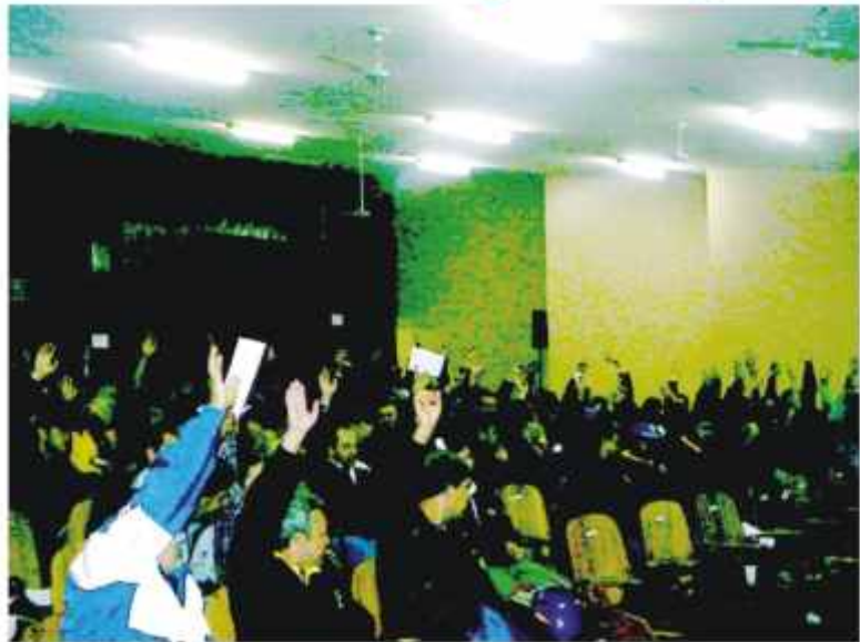
Assembléia do dia 01 rejeitou a proposta e aprovou o indicativo de greve

A greve é um direito legítimo dos trabalhadores, garantido na Constituição e neste momento é a arma que temos para forçar a direção da empresa a voltar para a mesa de negociação com uma proposta decente. Lucros a ECT tem. Tá faltando vontade política da direção da empresa para dar um aumento real nos salários!