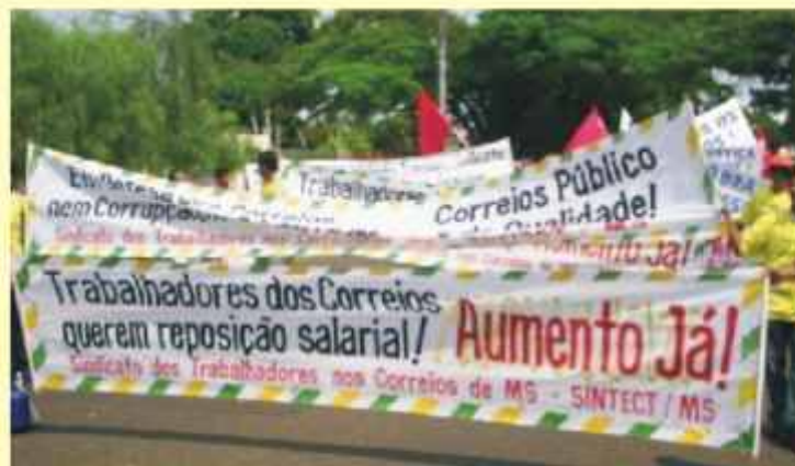
Sintect-MS presente no Grito dos Excluídos

Nesse dia distribuimos um "Boletim do Sintect" especial à população, esclarecendo nossa luta em defesa dos Correios Público.