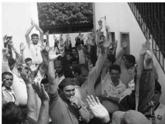
Assembléia no dia 17 em Campo Grande Companheiros/as rejeitam proposta da ECT e TST

Boletim do Sintect-MS é uma publicação do Sindicato dos Trabalhadores nos Correios, Telégrafos e Similares de MS, filiado à Fentect/CUT. Rua Barão do Rio Branco, 576. Fone/fax: 382-8752 Jornalista Responsável: Rosália Silva E-mail: sintectms@terra.com.br