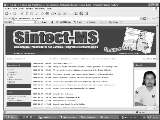
www.sintectms.org.br é o endereço do Sindicato

Foi lançado no dia 5 o site do Sintect-MS. Agora a categoria terá um meio mais ágil de informação que pode ser consultado a qualquer hora.